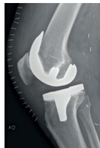
Knäprotes från sidan.